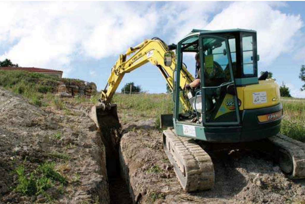
Un poêle norvégien doublé en fonte, constitue le seul chauffage de la maison.

Ni l'idée ni le principe ne sont nouveaux ! Pourtant, il semble que nous découvrons tout juste le puits canadien en France.